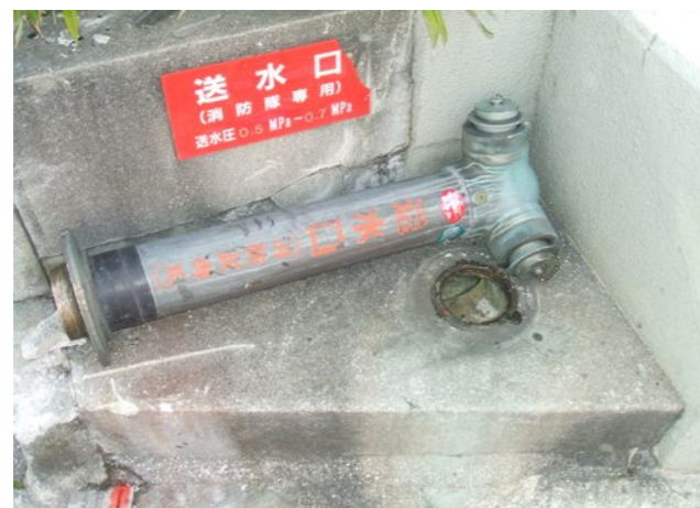
見事に倒れた送水口