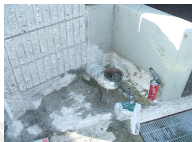
コンクリ撤去 継手を露出