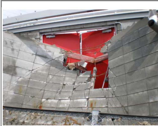
津波により破壊された外壁