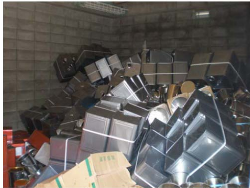
地震により落下した貯蔵庫内の容器