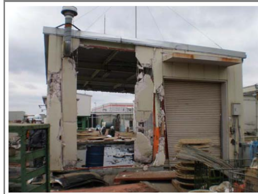
津波により破壊された外壁