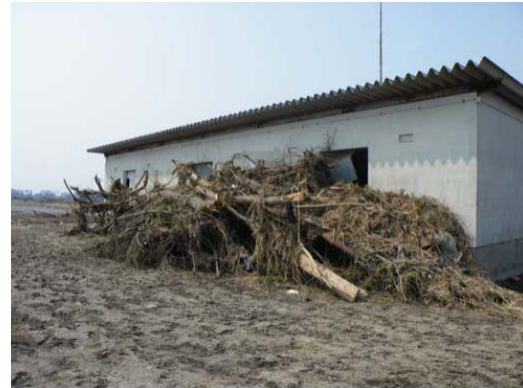
津波により土砂が堆積した様子