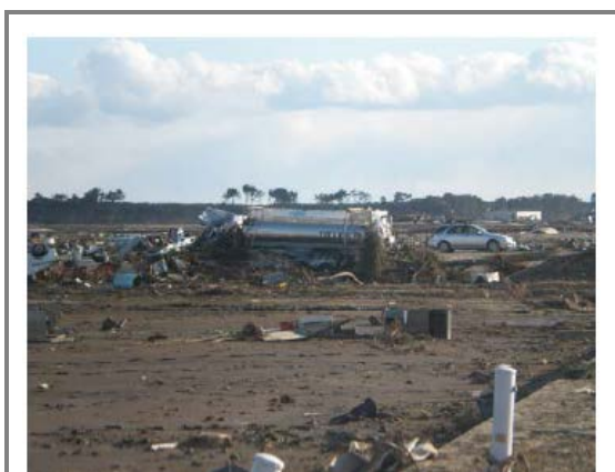
津波により破損した移動タンク貯蔵所

火災の 28 件は全て同一の製油所内の火災が移動タンク貯蔵所に類焼したものである。破損被害の詳細は不明であるが、津波により流されタンクを破損したものや電気設備等が海水に浸かり破損する等の被害が生じている。