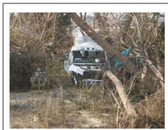
津波により破損した移動タンク貯蔵所