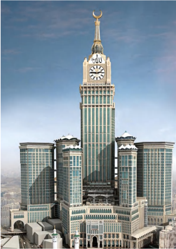
メッカロイヤルクロックホテル