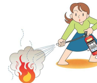
消火訓練の様子 10型の威力!

パニックのため、 使い方を思い出せず なんと消火器本体を投げつけ、着火した天ぷら油が 転倒! 家は 全焼!