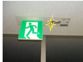
色々なタイプがあります