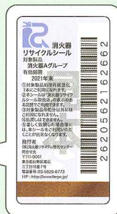
リサイクルシールが貼られています。

消火器のリサイクルは、耐用年数を過ぎた消火器を安全に廃棄・回収して部品等をリサイクルする取り組みです。2010年1月より社会実験として運用していましたが、いよいよ本格運用となります。