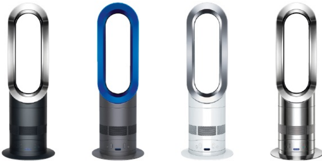
対象機種の様 映像

回収方法は、まず製品の底面にあるシリアル番号をダイソン公式サイトの特設ページで入力し、リコール対象か確認をしてくださいとのことです。メール japan@dysonrecall.com や専用の電話( 0120-210-905 )でも確認可能です。電話受付時間は(休日無)9時から17時30分。